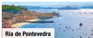
Ria de Pontevedra