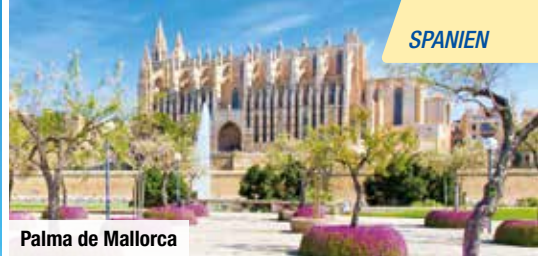
Palma de Mallorca