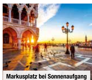
Markusplatz bei Sonnenaufgang

Halbpension 4 x Abendessen als 3-Gänge-Menü oder in Büfettform Bei Vorabbuchung € 69 p. P.