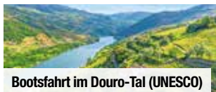
Bootsfahrt im Douro-Tal (UNESCO)