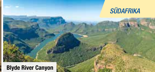
Blyde River Canyon