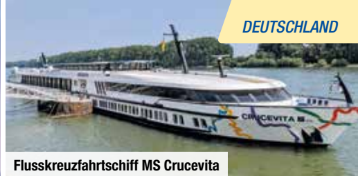
Flusskreuzfahrtschiff MS Crucevita