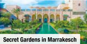
Secret Gardens in Marrakesch

Pfegeritual im marokkanischen Hamam Finden Sie Entspannung beim traditionellen marokkanischen Baderitual (inkl. Transfer) Nur Vorabbuchung € 59 p.P.