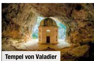
Tempel von Valadier