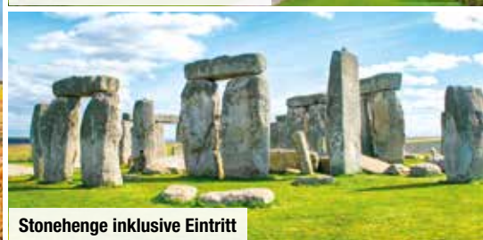
Stonehenge inklusive Eintritt