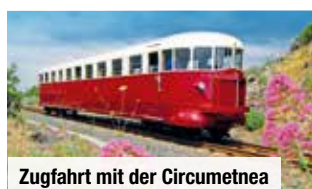
Zugfahrt mit der Circumetnea