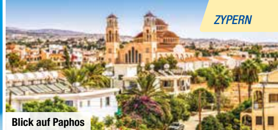
Blick auf Paphos