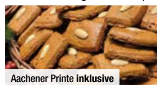
Aachener Printen inklusive