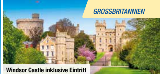
Windsor Castle inklusive Eintritt