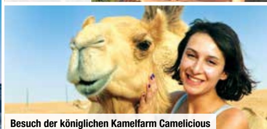
Besuch der königlichen Kamelfarm Camelicious