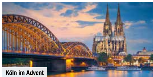
Köln im Advent