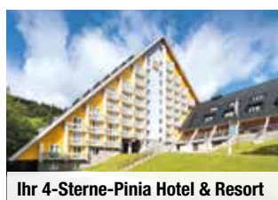
Ihr 4-Sterne-Pinia Hotel & Resort

Hinweis: An vielen Reisetagen stehen teils längere Wanderungen an. Daher eignet sich die Reise nicht für Teilnehmer mit eingeschränkter Mobilität. Bitte beachten Sie, dass sich der Routenverlauf der Wanderungen je nach Leistungsniveau Ihrer Wandergruppe und der Witterungsbedingungen ändern und dass sich die Wanderung an Tag vier je nach Reisezeitraum und Witterung auf bis zu 12 Kilometer verlängern kann.