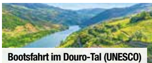
Bootsfahrt im Douro-Tal (UNESCO)