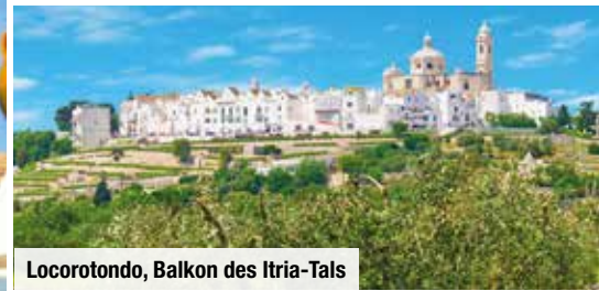
Locorotondo, Balkon des Itria-Tals