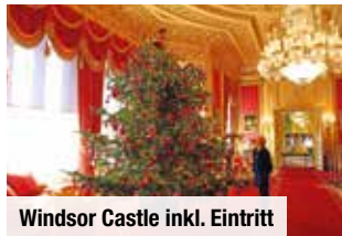
Windsor Castle inkl. Eintritt

bei einem geführten Rundgang, bevor Sie Eintritt in das königliche Windsor Castle erhalten. Das prachtvolle Schloss zeigt sich in der Weihnachtszeit herrlich geschmückt – ein Anblick zum Träumen, den Sie sich keinesfalls entgehen lassen sollten! Ihr nächstes Highlight ist der Besuch von Oxford. Wie Sie bei Ihrer Stadtbesichtigung sicherlich feststellen werden, gehört die Universitätsstadt zu den schönsten Städten Englands. Ein Besuch zur Weihnachtszeit ist daher besonders atmosphärisch. Bei freier Zeit genießen Sie das Flair.