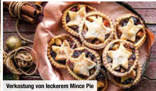
Verkostung von leckerem Mince Pie