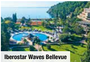
Iberostar Waves Bellevue

Was gibt es Schöneres, als im Urlaub aufzuwachen und vom Balkon aus das tiefblaue Meer zu sehen? Buchen Sie jetzt günstig Ihr exklusives Zimmer zum Garten mit Meerblick! Nur Vorabbuchung € 30 p. P./Nacht