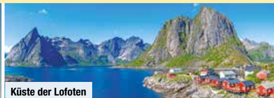
Küste der Lofoten