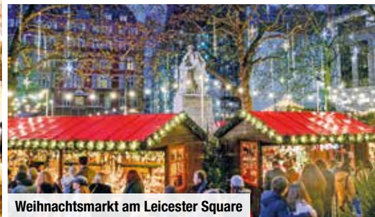
Weihnachtsmarkt am Leicester Square