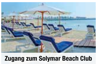
Zugang zum Solymar Beach Club

5-Sterne-Hotel The Grove & Conference Centre mit exklusivem Zugang zum Solymar Beach Club Nur Vorabbuchung Doppelzimmer € 299 p. P. Einzelzimmer € 440 p. P.