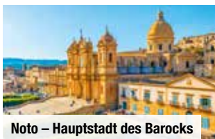
Noto – Hauptstadt des Barocks