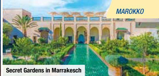
Secret Gardens in Marrakesch

Das macht unsere Reisen in der Kleingruppe so besonders! ✓ Bestes Preis-Leistungs-Verhältnis ✓ Intensive Erlebnisse durch die kleine Gruppe