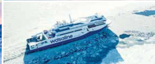
Eiskreuzfahrt mit der Wasaline