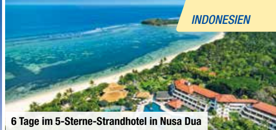
6 Tage im 5-Sterne-Strandhotel in Nusa Dua