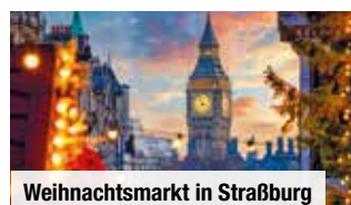
Weihnachtsmarkt in Straßburg

Tag 2: Heute bestaunen Sie auf Ihrer Stadtrundfahrt berühmte Sehenswürdigkeiten wie Westminster Abbey, Houses of Parliament, Tower Bridge und Buckingham Palace. Nach einem Stopp am berühmten Trafalgar Square besuchen Sie gemeinsam den stimmungsvollen Weihnachtsmarkt am Leicester Square . Bei freier Zeit genießen Sie den Adventszauber entlang der zahlreichen geschmückten Buden. Ein Highlight ist später am Tag Ihre abendliche Lichterfahrt durch