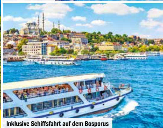
Inklusive Schiffsfahrt auf dem Bosphorus

Ihre Wahl: auch als Kleingruppen-Rundreise buchbar!