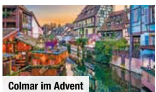
Colmar im Advent