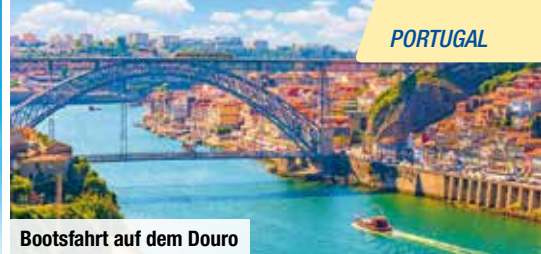
Bootsfahrt auf dem Douro