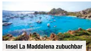
Insel La Maddalena zubuchbar

Ausflug „Naturbelassenes Paradies – die Insel La Maddalena“ inklusive Fährrüberfahrt, Panorama-Inselrundfahrt sowie Besuch der Altstadt € 79 p.P. Bei Vorabbuchung sparen Sie € 10 p.P. € 69 p.P.