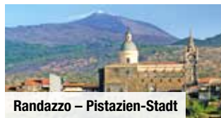
Randazzo – Pistazien-Stadt

Bei Vorabbuchung sparen Sie € 10 p.P. € 59 p.P. € 49 p.P.