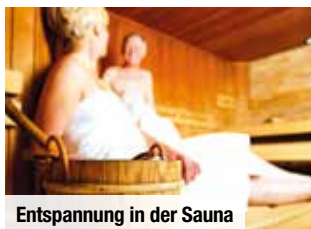
Entspannung in der Sauna