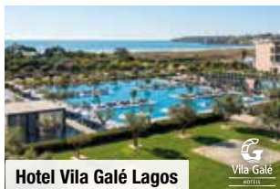
Hotel Vila Galé Lagos