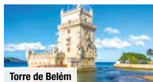
Torre de Belém