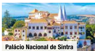
Palácio Nacional de Sintra

Zug zum Flug: Hin- & Rückfahrt von und zu allen deutschen Bahnhöfen, 2. Klasse € 79 p. P.