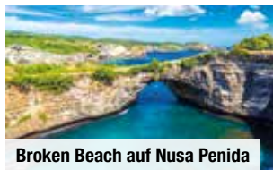
Broken Beach auf Nusa Penida

Bei Vorabbuchung sparen Sie € 10 p. P. € 129 p. P.