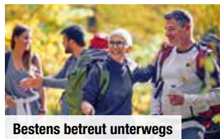
Bestens betreut unterwegs