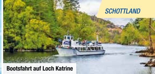
Bootsfahrt auf Loch Katrine

Zug zum Flug: Hin- & Rückfahrt von und zu allen deutschen Bahnhöfen, 2. Klasse € 79 p. P.