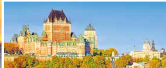
Château Frontenac, Québec City