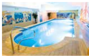
Hallenbad im 4-Sterne-Sanatorium

Weitere Informationen & Hinweise Für Alleinreisende: Einzelzimmer (+ € 29 p. N.) und ½ Doppelzimmer (Zweibett, Unterbringung mit einer Person gleichen Geschlechts) ohne Aufpreis verfügbar. Dreierbelegung ohne Aufpreis verfügbar. Mindestteilnehmerzahl: 36 Personen/Termin. Bei Nichterreichen kann die Reise bis 30 Tage vor Reisebeginn abgesagt werden. Nicht inklusive: Die Kurtaxe von ca. € 1,60 pro Person und Nacht ist vor Ort im Hotel zu entrichten (Stand: Juni 2026). Die Parkplatzkosten von ca. € 3,50 pro Tag sind an der Hotelrezeption zu entrichten. Die Eigenreise ist bis 14 Uhr möglich. Bei späterer Ankunft bitten wir um eine Mitteilung an das Hotel.