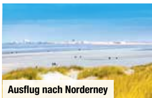
Ausflug nach Norderney