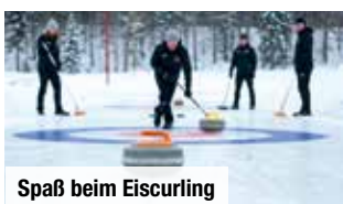
Spaß beim Eiscurling

Tag 4: Heute erwartet Sie eine Winterwanderung . Anschließend wärmen Sie sich am Feuer auf. Lassen Sie sich Ihre Chance nicht entgehen und nehmen Sie auch am