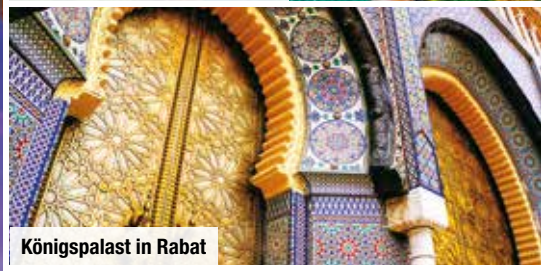
Königspalast in Rabat