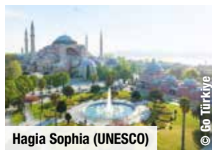
Hagia Sophia (UNESCO)

Tag 3: Sie sehen heute die Süleymaniye-Moschee im Hafenviertel Eminönü, bevor Sie das historische Viertel Fener und das jüdische Viertel Balat mit der Georgskathedrale erkunden und den herrlich duftenden Gewürzbasar besuchen. Am Nachmittag Besuch des Galata-Viertels mit der Galata-Brücke .