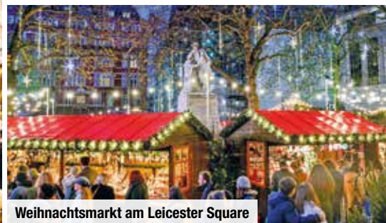
Weihnachtsmarkt am Leicester Square