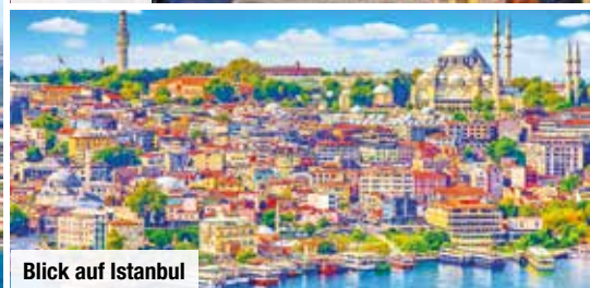
Blick auf Istanbul