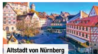
Altstadt von Nürnberg