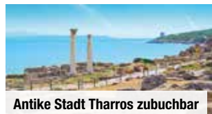
Antike Stadt Tharros zubuchbar

Ausflug „UNESCO-Weltkulturerbe Su Nuraxi & antike Stadt Tharros“ inklusive Eintritt in Su Nuraxi & Bimmelbahnfahrt € 79 p.P. Bei Vorabbuchung sparen Sie € 10 p.P. € 69 p.P.