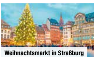
Weihnachtsmarkt in Straßburg

Verfügbare Termine unter norma-reisen.de