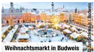
Weihnachtsmarkt in Budweis