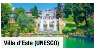
Villa d'Este (UNESCO)

Verfügbare Termine unter norma-reisen.de